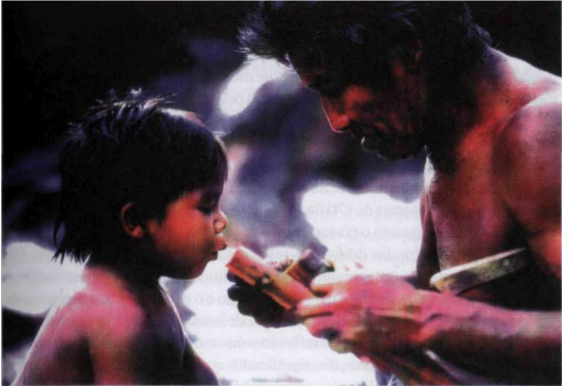
FIGURA 3 - A educação indígena passada de geração a geração

Fonte: Foto indexada no Referencial Curricular Nacional para as Escolas Indígenas – RCNEI. Homem e menino Tucano, AM (Piotr Jaxa/ISA - 1993, p. 19). Arquivo em PDF. Disponível em: Http://www.dominiopublico.gov.br . Acesso em: 18/03/2012.