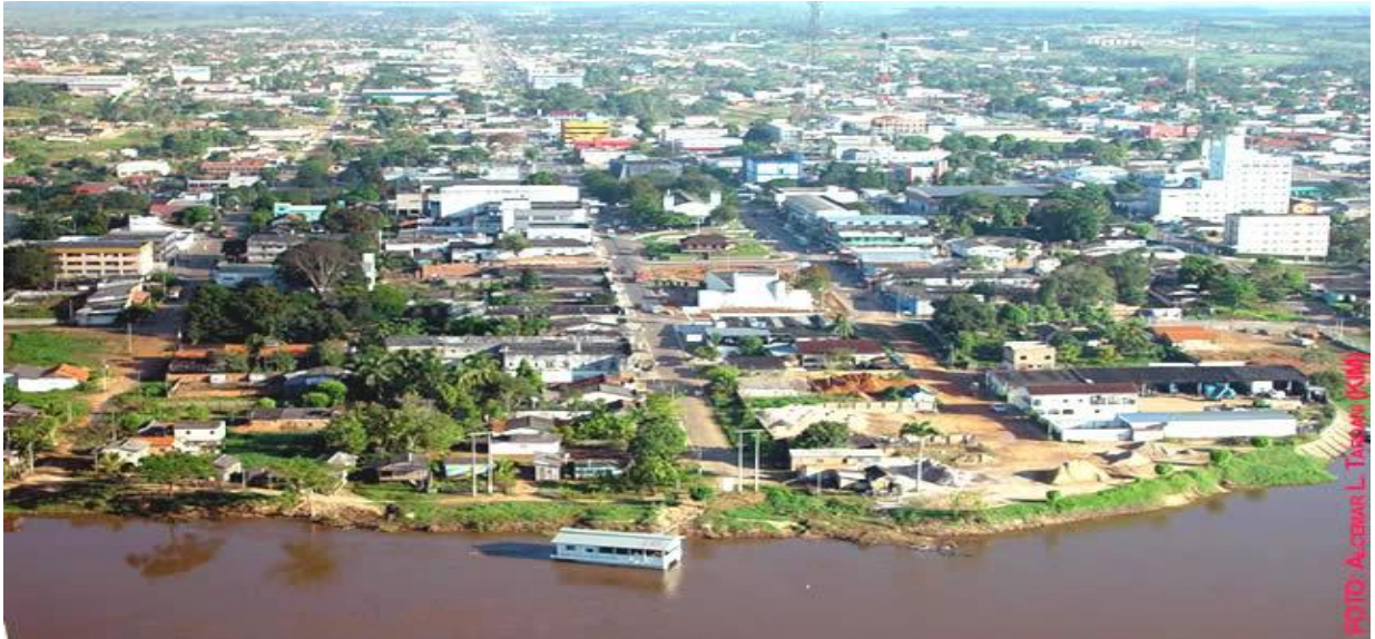
Figura 2 - Fotografia aérea do centro urbano de Ji-Paraná